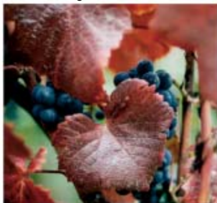
Miniguide om druvor...12